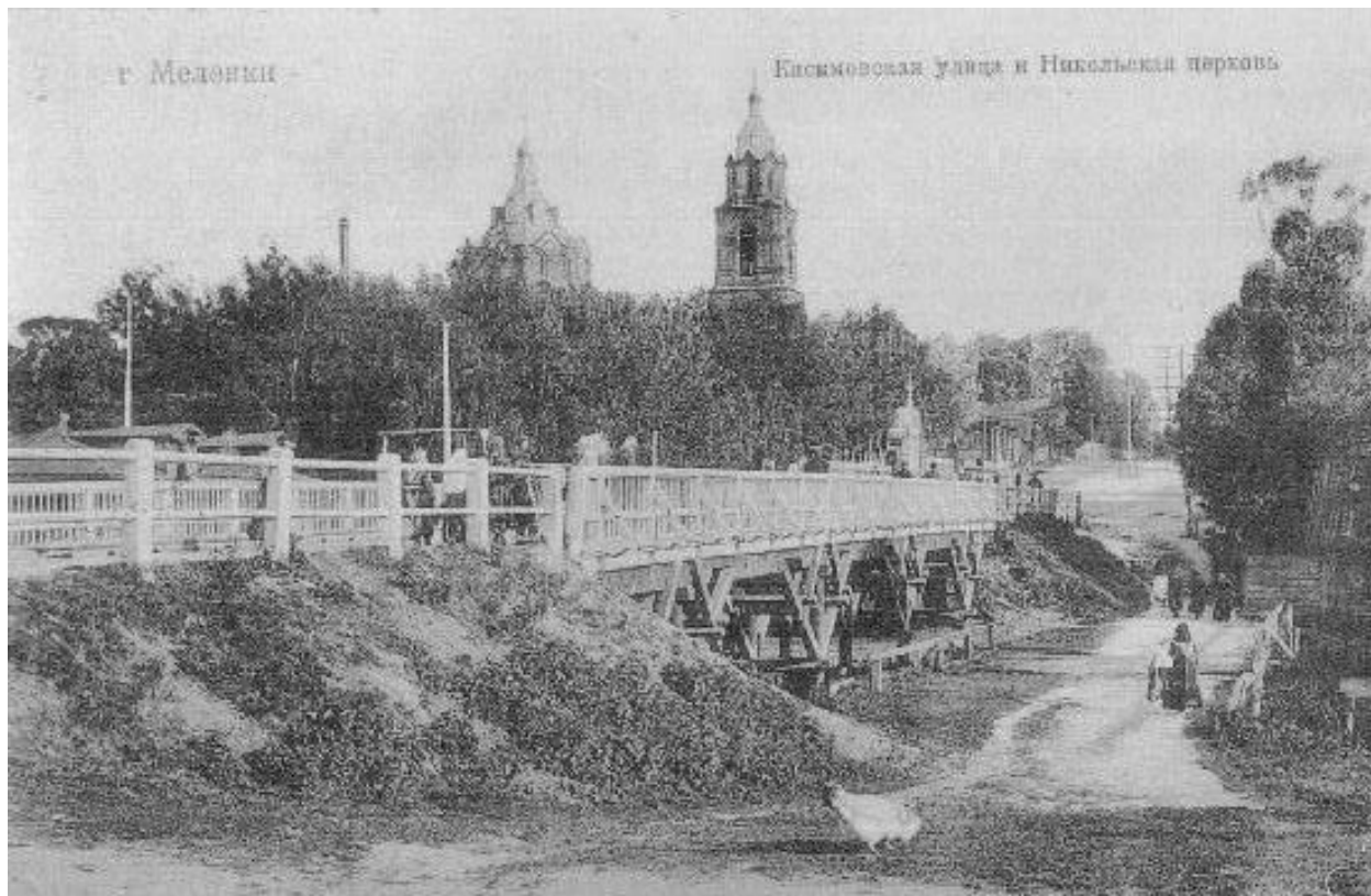
Никольский храм г. Меленки. Фото 1920-х гг.