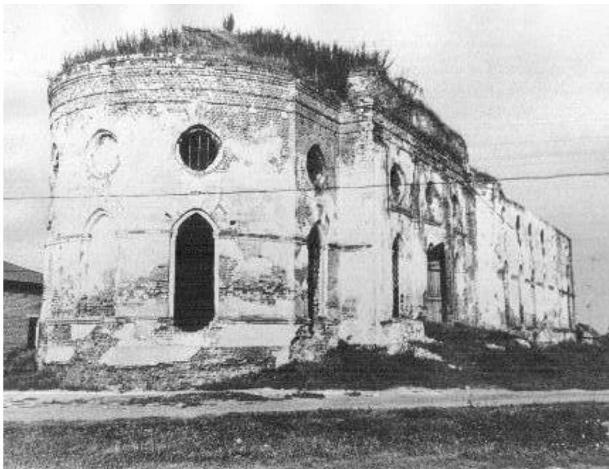
Никольская церковь, с. Бутылицы, фото 1970-х гг.