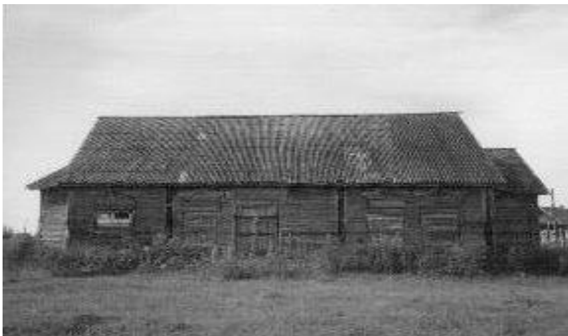
Рис. 2. Предтеченская церковь с. Двойново, современное фото 2005 г.