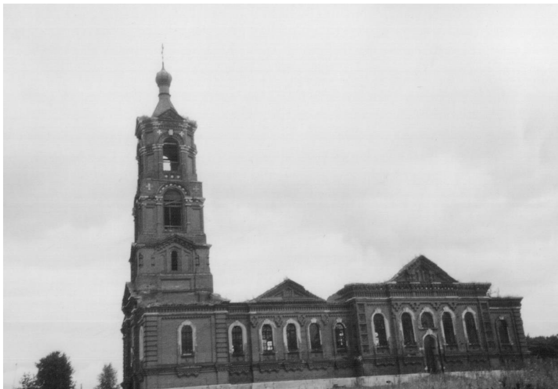
Рис. 1. Казанская церковь Верхозерского погоста, с. Верхозерье, фото 2005 г.