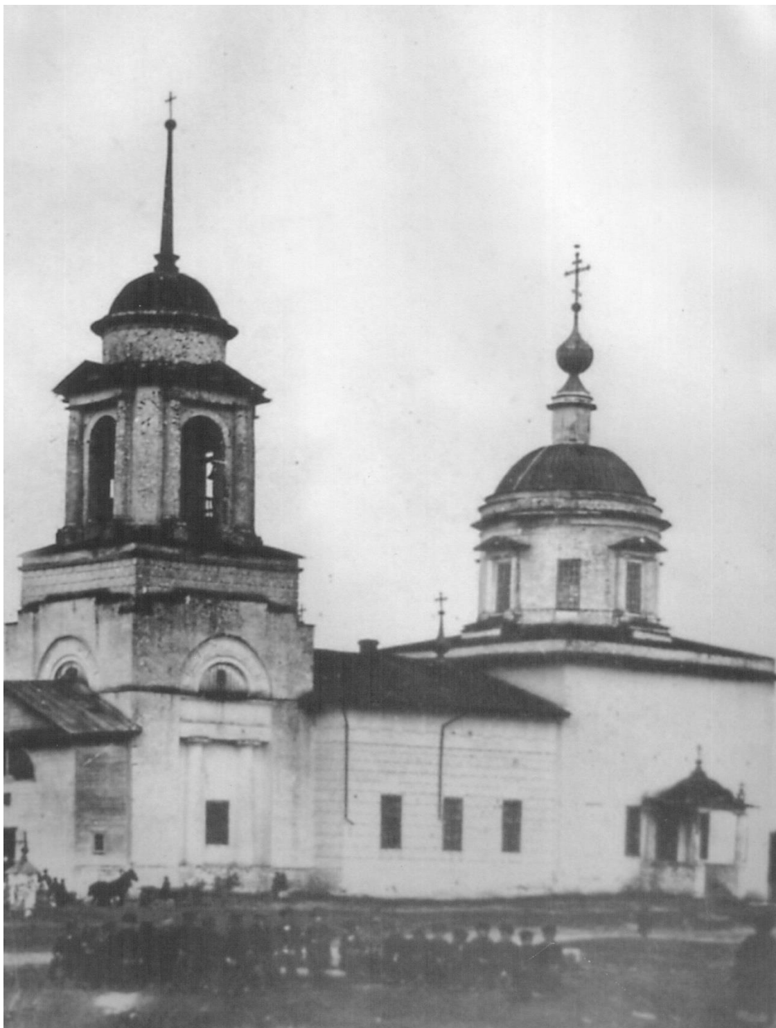
Казанская церковь, с. Денятино