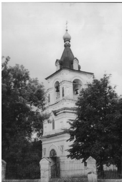
Рис. 1. Колокольня Никольского храма, с. Степаньково, фото 2005 г.