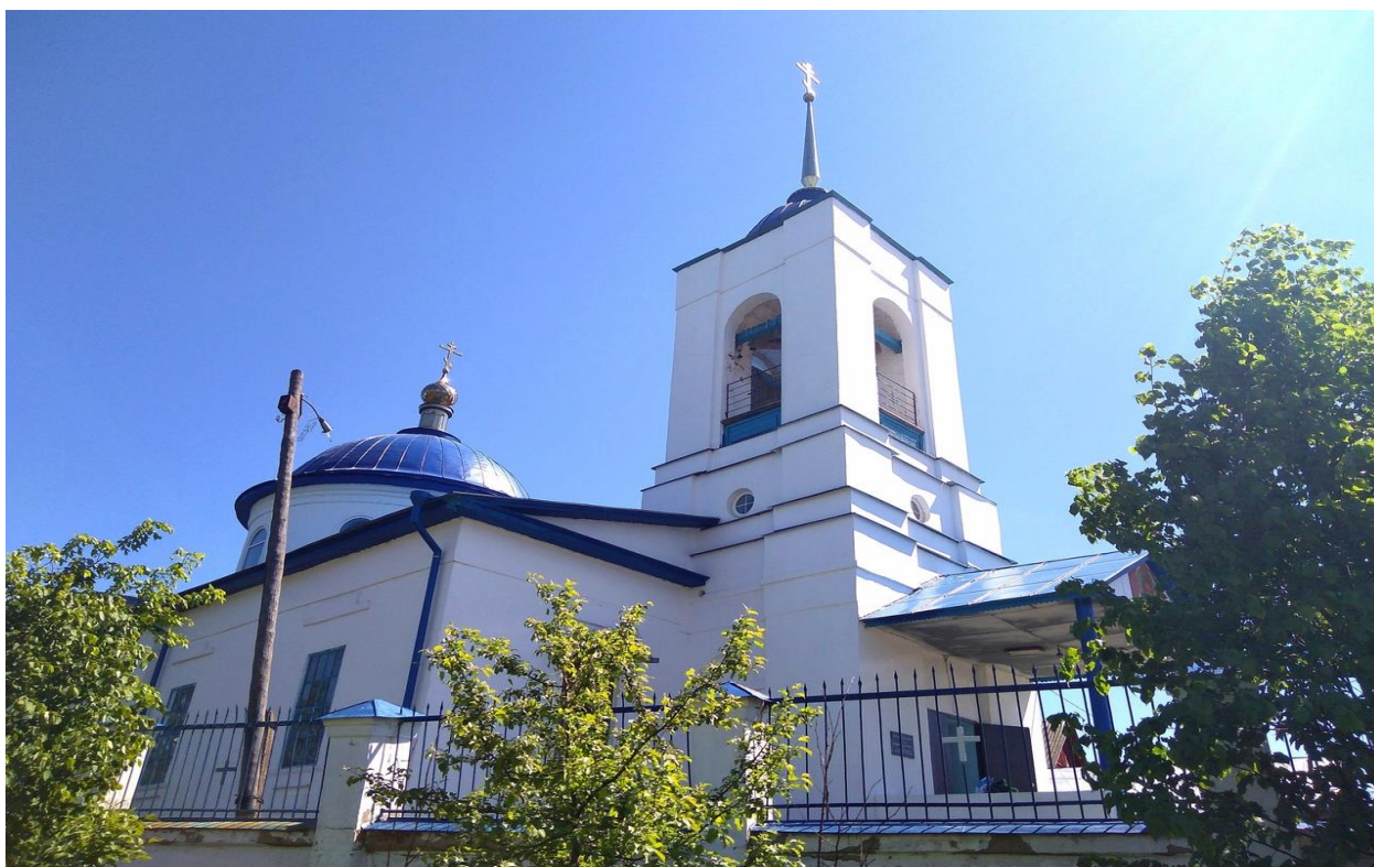
Рис. 2. Храм Архангела Михаила, современный вид, фото 2019 г.