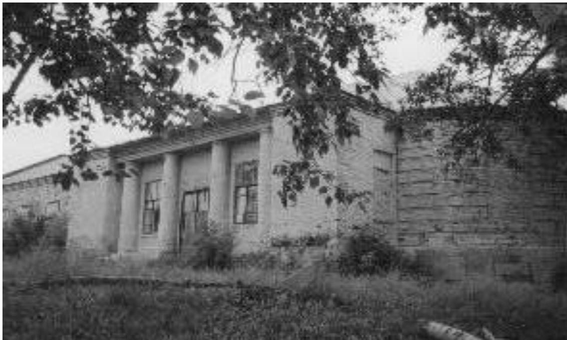
Рис. 1. Церковь во имя Рождества Пресвятой Богородицы с. Урваново, фото 2004 г.