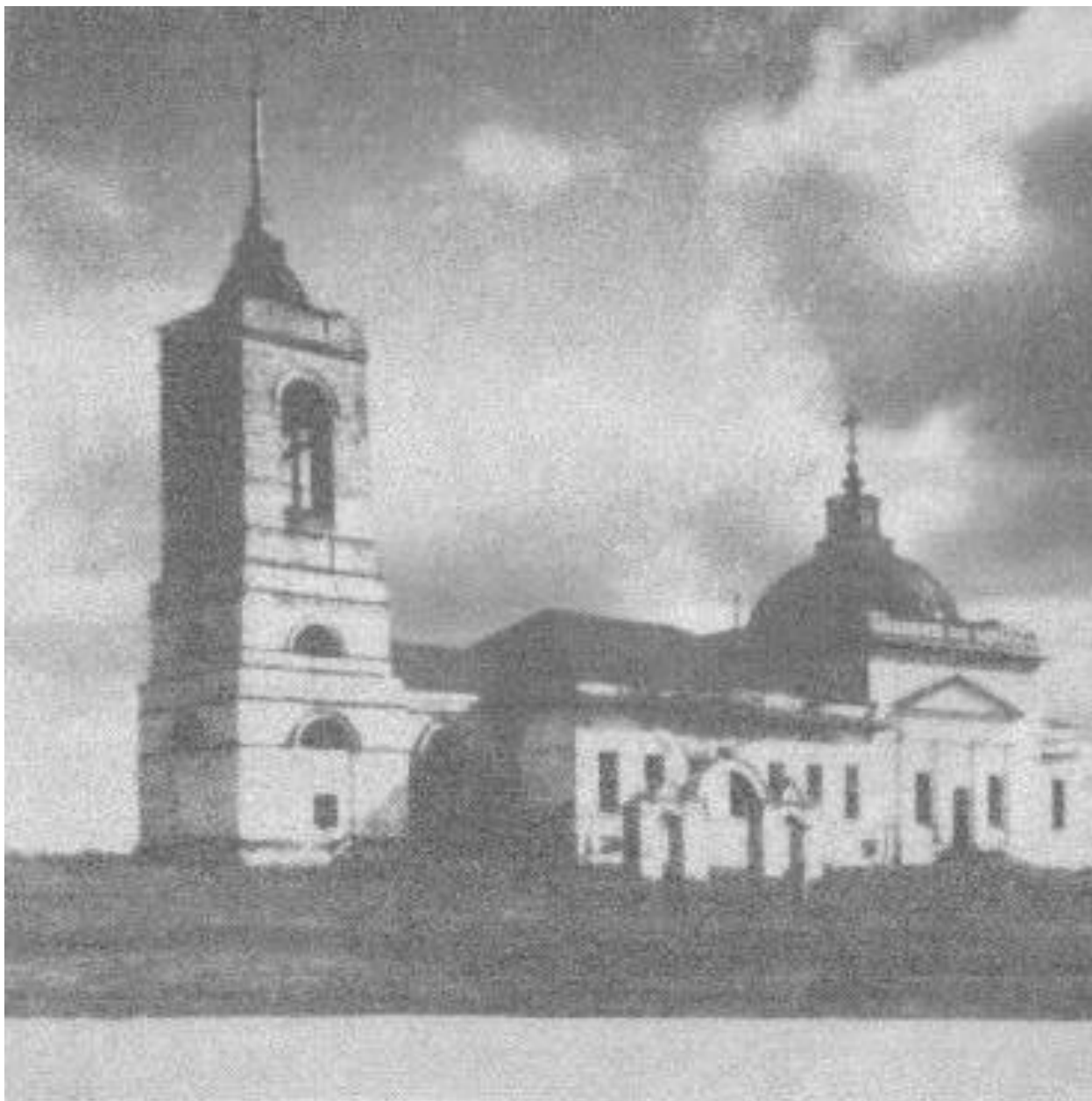
Каменный храм Иговского погоста