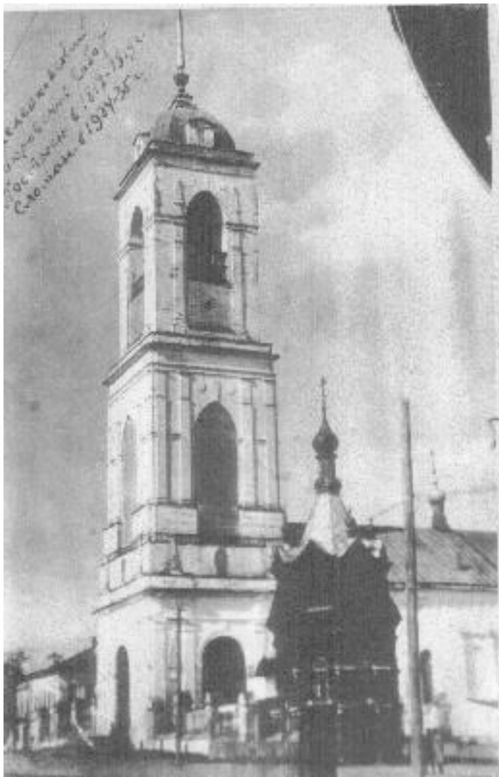
Покровский собор, г. Меленки, фото нач. XX в.