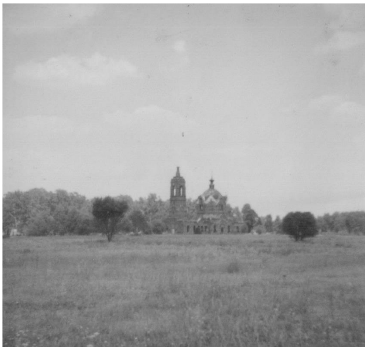
Предтеченская церковь Куземского погоста (поле за д. Скрипино Меленковского района),