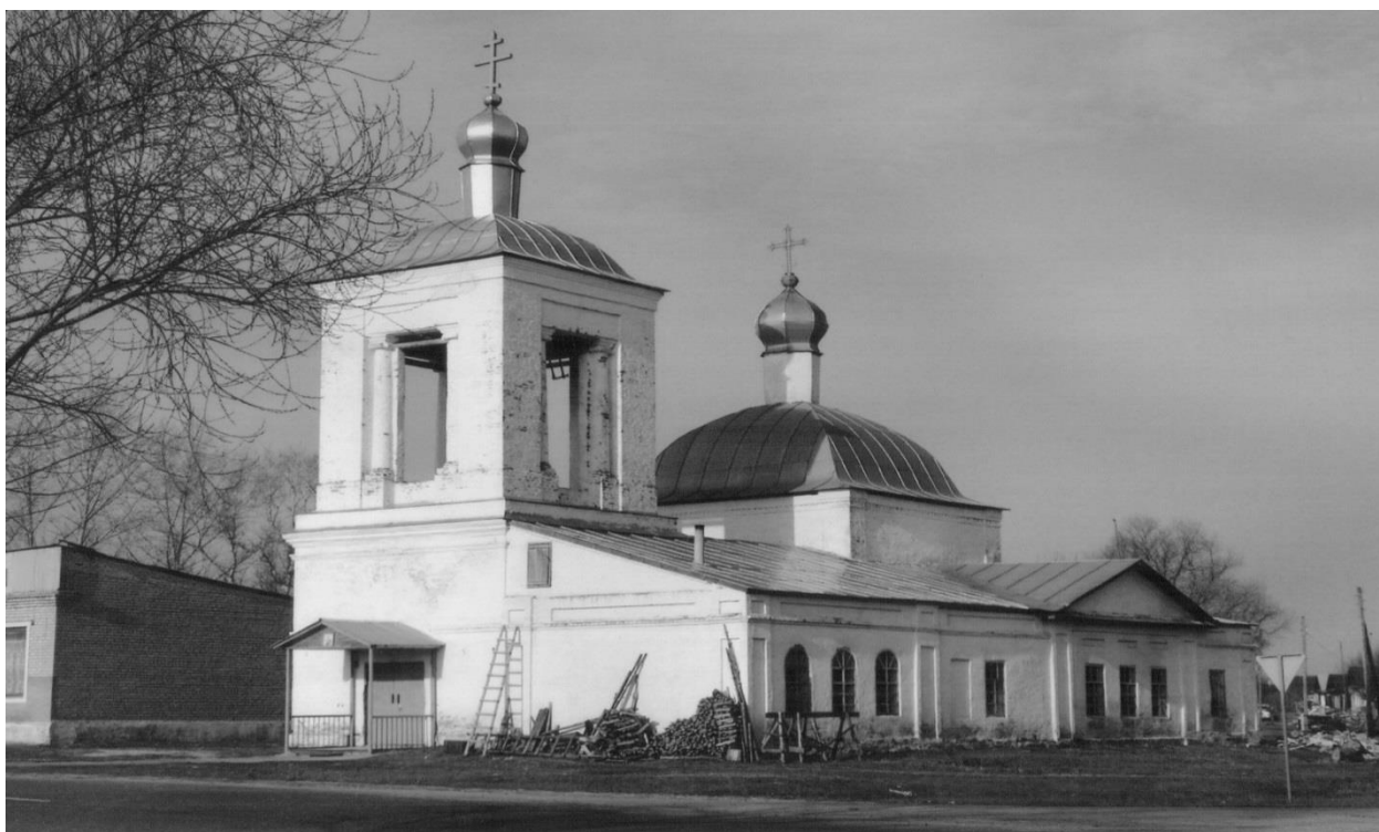
Рис. 2. Церковь во имя Архистратига Божия Михаила, с. Архангел, фото 2006 г.