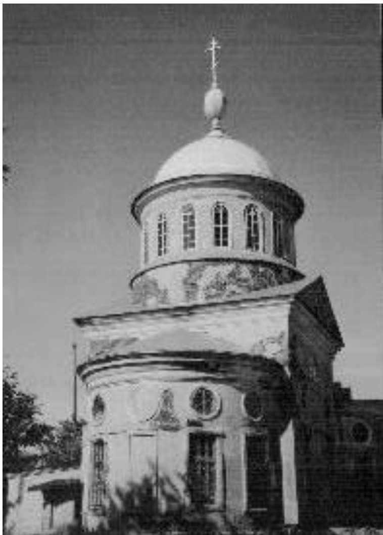
Спасская церковь, с. Ляхи, фото 2006 г.