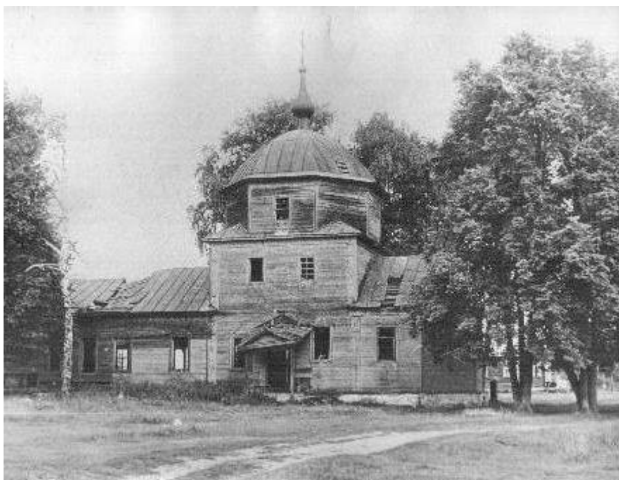
Рис. 2. Церковь Рождества Христова, с. Окшово, фото 1970-х гг.